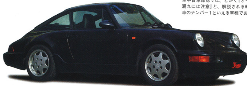
92年式ポルシェ911カララ2。輸入車中古車雑誌では、とかく「オイル漏れには注意」と、解説される輸入車のナンバー1といえる車種である。