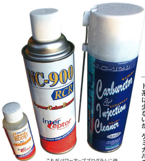
これがパワーアッププログラムに使うケミカル3種。右から、キャブレター&インジェクションクリーナー、カーボンリムーバー、コンプブースターだ。

バイクライフを支えているのは、ビッグバイクばかりではない。 通勤の足として、スクーターをセカンドバイクに使う人も多い。 今回はそこにちょっとした遊び心を加え、日常がグッと面白くなるというオハナシ。