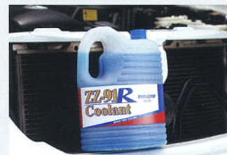
ZZ-91R coolant 不凍冷却液 価格:3570円(2ℓ)

夏は水温の上昇する季節。オーバーヒートを未然に防ぐために熱伝導効率が高く、冷却水の温度を低減させてくれるクーラント「ZZ91R」をおススメします。コンプレーストとセットで使えば、愛車もドライバーも冷え冷えですよ!