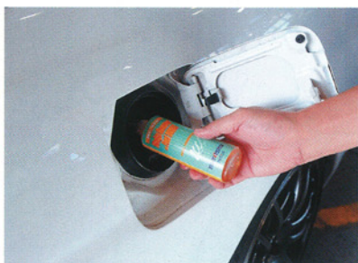
フェーエルラインをきれいにするNC-220を注入。ラインの汚れがガソリンと共にシリンダーへ入るのを防ぐ!

簡単に選択可能な商品構成 あなた好みのワンオフも可 085号では、トランスミッション ンオイルとデフォイル、そしてプレ ーキフルードを交換。これによって 全オイルのニューテック化が完了し た。トランスミッションは、投入前 はギヤが入りにくくなるという状況 も稀にあったが、ニューテック投入 後はスムーズなシフトフィーリング を実現してくれる。 一番違いを感じられたのはプレー キフルードである。サーキット向け と聞いていたので最初は身構えてい た。しかし、実際に踏んでみると以 前よりも扱いやすいことに気がつく。 ペダルフィーリングは大幅に向上し、 思い描いた理想どおりにペダルコン トロールができる。本誌33号のトラ スト製ビッグキャリパーでも体感で きたので、純正キャリパー車ならば もっと違いを体感できるかもしれな い。制動力強化のためにパッド交換 を検討している人には、まずニュー テックのブレーキフルード交換をお 勧めしたい。