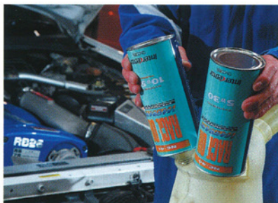
今回はフルチューンエンジンに最適な混合比にブレンドした。自分好みに仕立てられるのもニューテックの強み

©NUTEC ☎045-628-2055 http://nutec.jp 販売代理店 ©日本オイルサービス ☎042-542-8861 文:本誌