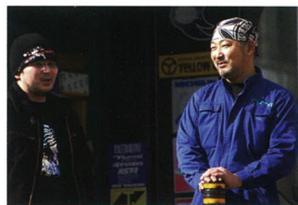
集まるのはVMAX好きだけではない。ビッグバイクは分け隔てなく扱う。写真左側のお客さんは現行Z1000のオーナー。ニューテックを使うキッカケも、この人がススメたことから。

すい。現にウチにやってくるミッションコンラブルの例は、1〜2速のドグやボスが傷んでいることが多いです」 それがニューテックのオイルを使い出してから、旧さを感じるエンジンをウマクバランスさせることができるようになってきたという。ニューテックのオイルは、流動性が高い(柔らかい)割りには油膜が強力なのが特徴。一般的には、流動性が高ければ、ピストンリングとシリンダー間など、クリアランスの大きいエンジンではオイルが燃焼室に吹き抜けてしまい、一緒に燃えることでオイル喰いが激しくなる傾向がある。それゆえ硬めのオイルを使うのだが、その弊害は先に述べたとおり。ところがニューテックはその吹き抜けが少なく、現にVMAXのエンジンオイルの消耗スピードがこれまでのもものモノに比べ落ちたという。