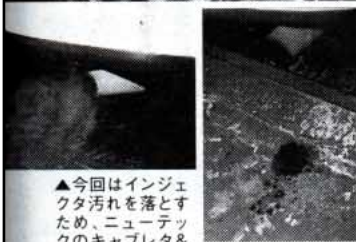
▲今回はインジェクタ汚れを落とすため、ニューテックのキャブレター&インジェクタクリーナーをコンプレーストとあわせて使用。こちらはオープン価格